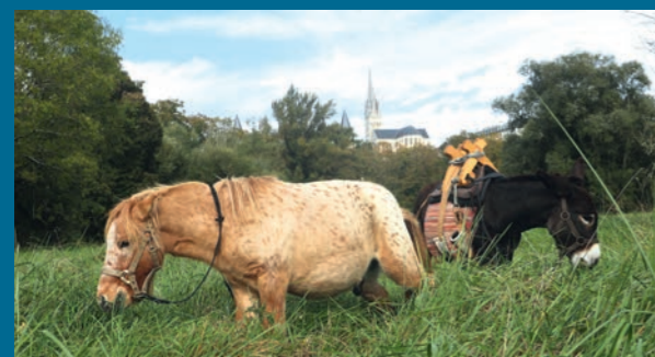
Major et Isidor harnaché de son bât

Contact: lherbequipousse.asso@gmail.com Tél. 07 67 72 02 94 www.helloasso.com/associations/l-herbe-qui-pousse