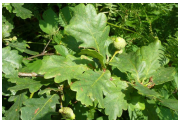
Chêne pédonculé reconnaissable au long pédoncule qui porte les glands

Ce bois communal d'une superficie de 61,26 ha est une forêt ancestrale gérée par l'ONF. On peut voir de jeunes plants protégés par des tubes abris. On y trouve surtout des hêtres, des chênes pédonculés, des châtaigniers, des robiniers et même des lauriers palmés qui se sont égarés là. Au ras du sol prospèrent de nombreuses espèces adaptées aux milieux humides : plusieurs variétés de fougères comme la scolopendre ou des carex aux longues feuilles coupantes qui font des touffes d'où émergent une haute fleur à l'épi retombant.