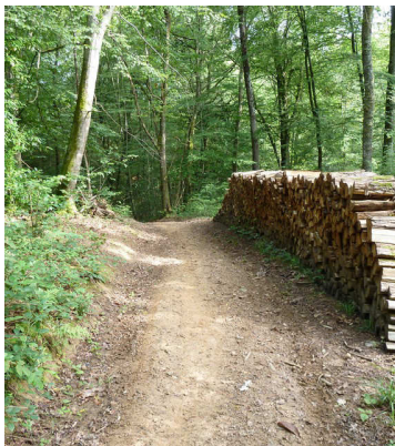
Bois de Gelos