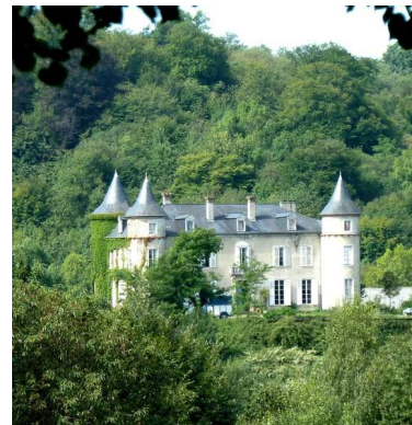
Château de Tout-y-Croît (domaine privé)