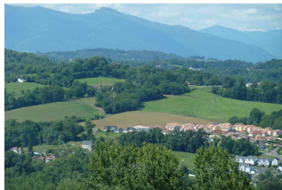
Vue sur les coteaux et les Pyrénées