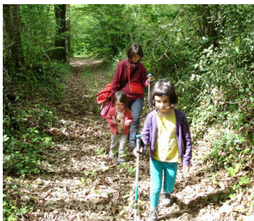
Les sous-bois du chemin Sansanné