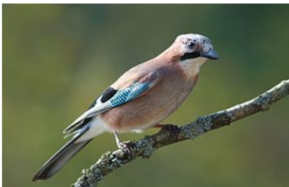
Le geai des chênes