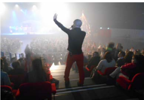
Aldebert à Lourdes