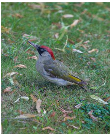
Le pic vert