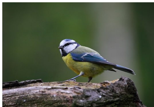
La mésange bleue